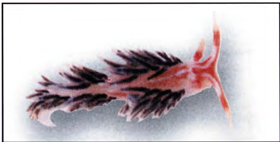
Foto 1.- Pruvotfolia rochebruni , especie nueva. Bahía de Faja (localidad tipo), isla de Brava, Cabo Verde.