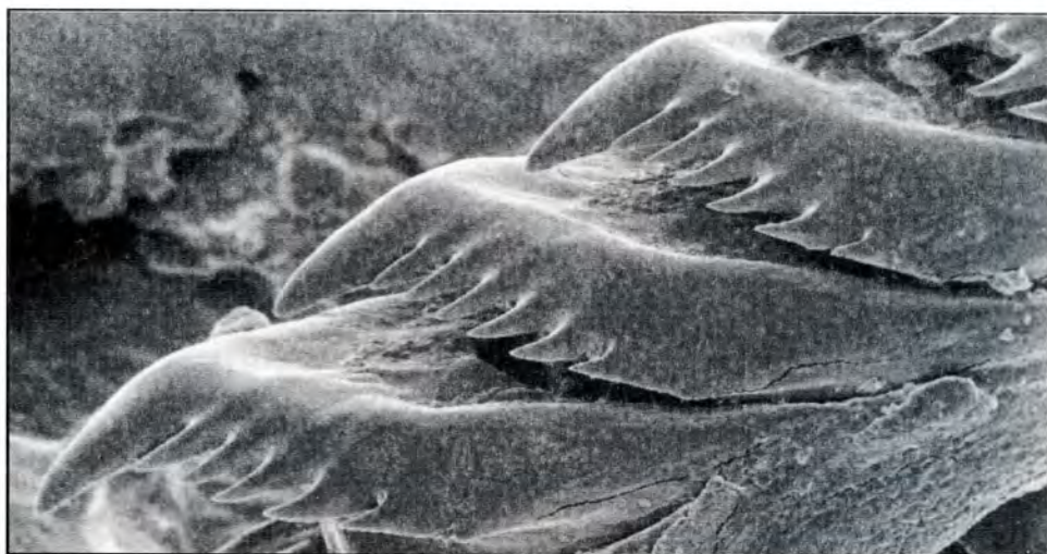
Figura 3.- Facelinopsis marioni (Vayssiere, 1888). Detalle del diente radular.