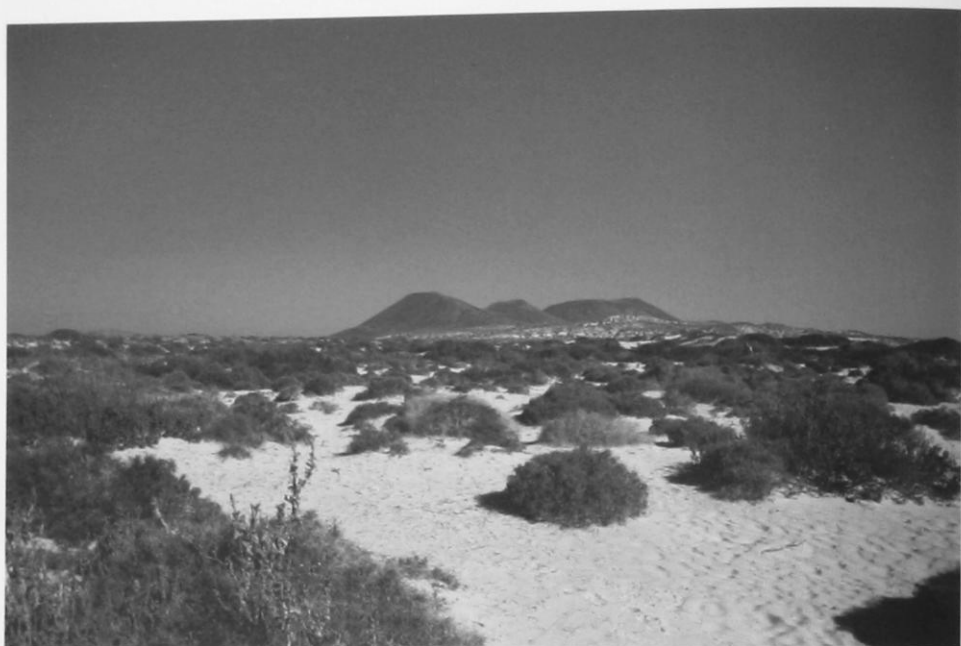
Foto 1.- Los arenales de La Graciosa, dominados por quenopodiáceas, son el hábitat típico de Agrotis lanzarotensis .