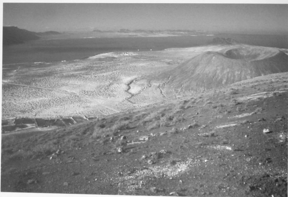
Foto 2.- Vista del extremo sur de La Graciosa desde lo alto de la montaña de Las Agujas. Se observa el cráter de la montaña del Mojón, y al fondo la cima de Montaña Amarilla y la zona de Famara en Lanzarote.