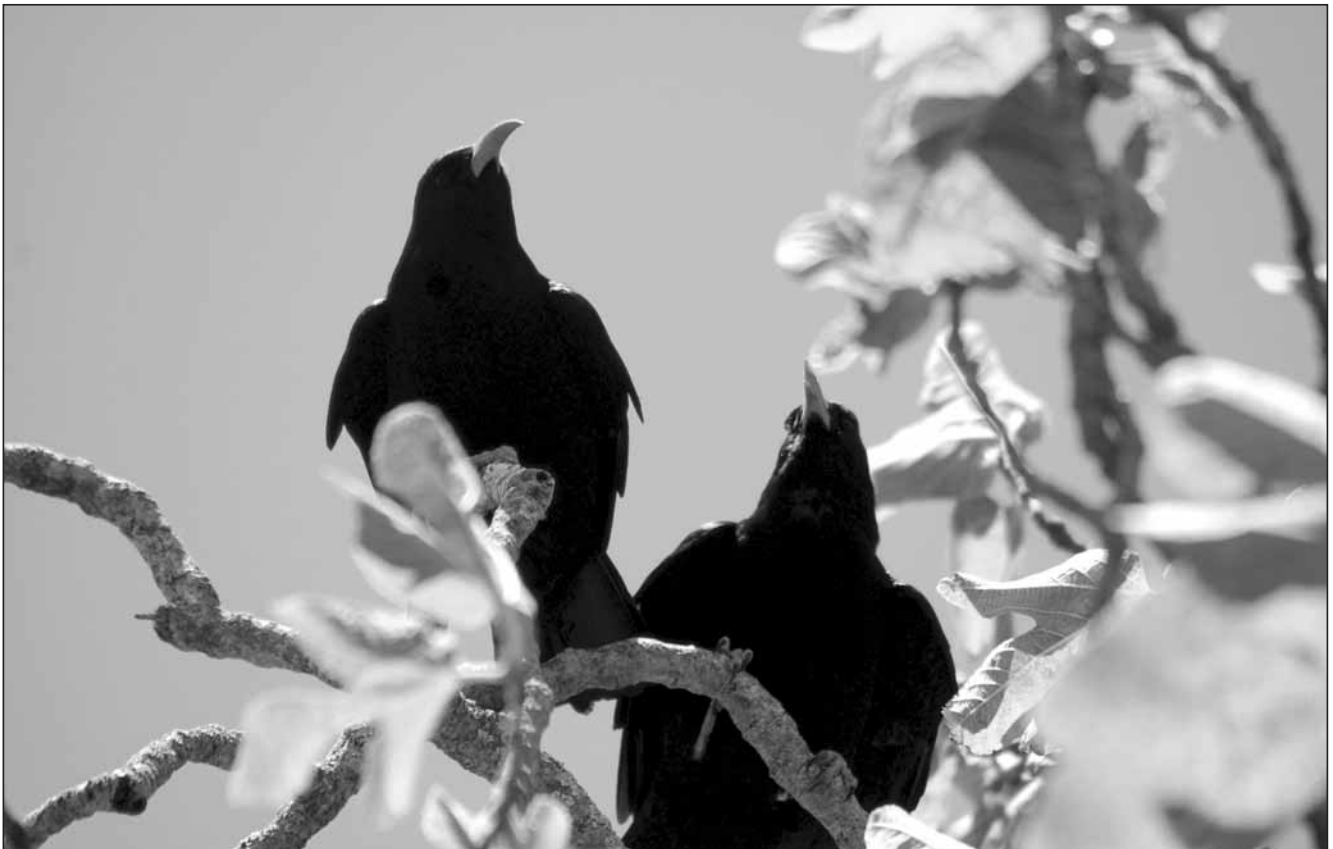
Foto 3. Las chovas en La Palma con frecuencia acceden a los árboles (en este caso una higuera) en busca de frutos que forman una parte importante de sus dieta.

Photography 3. Red-billed choughs in La Palma often perch on trees (a fig tree in this case) to feed upon fruits that constitute an important part of their diets.