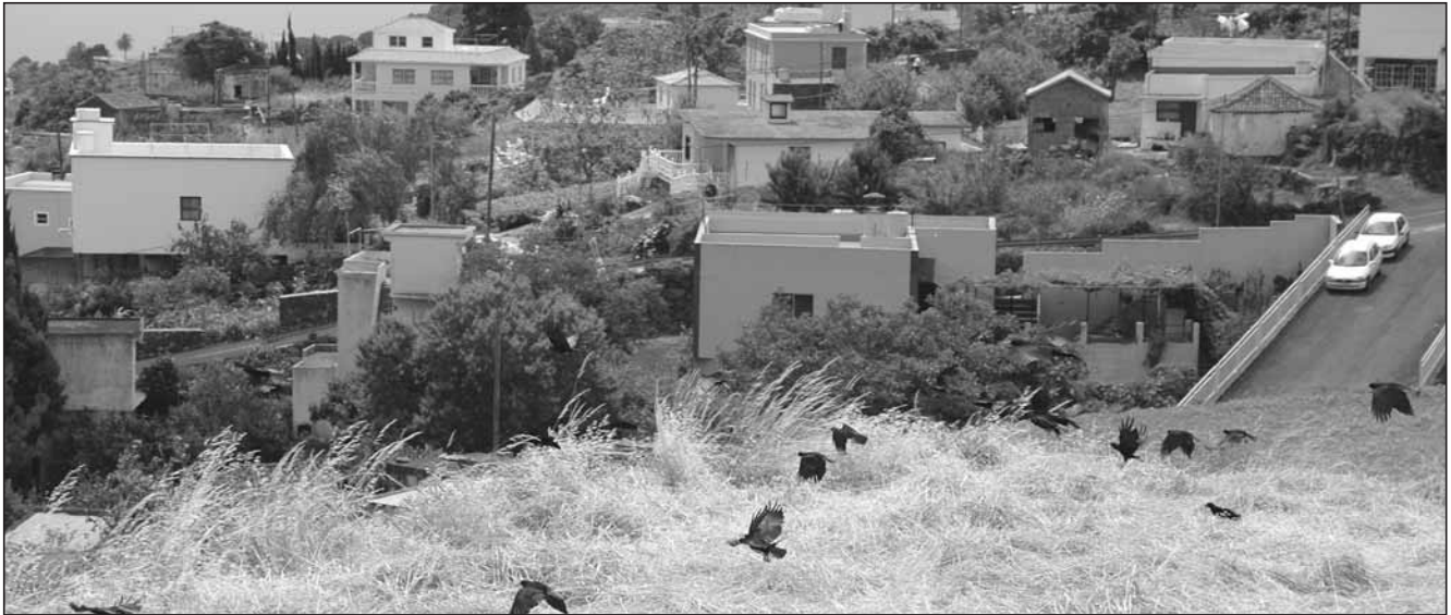
Foto 2. Las pequeñas parcelas agrícolas en medianías son muy importantes para la alimentación de la chova piquirroja en La Palma, pero se encuentran en un grave proceso de desaparición debido a la urbanización del medio.

Photography 2. Small agricultural fields at low areas are very important foraging places for red-billed choughs in La Palma, but they are progressively being lost due to urbanization.