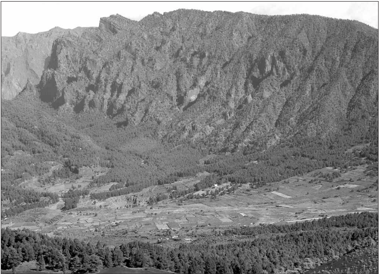
Foto 1. Las chovas piquirrojas se alimentan en pinares, zonas agrícolas y pastizales fuera de los límites del Parque Nacional de La Caldera de Taburiente.

Photography 1. Red-billed choughs in La Palma forage in pinewoods and agricultural and pasture lands outside the National Park of La Caldera de Taburiente.