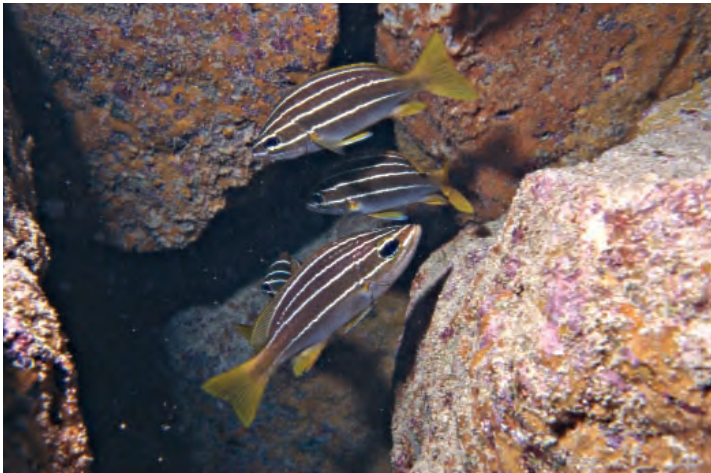
Figura 3. Parapristipoma humile (arriba y centro) y P. octolineatum (abajo).