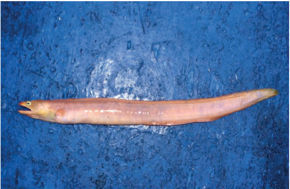
Figura 1. Dos especies guineanas poco conocidas: Pseudogramma guineensis (arriba) y Myroconger compressus (abajo).