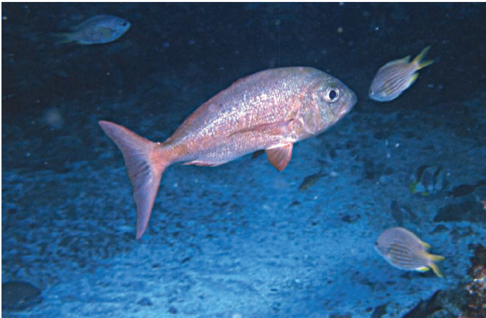
Figura 2. Especies pertenecientes a géneros monotípicos endémicos de las islas de Cabo Verde: Similiparma hermani (arriba) y Virididentex acromegalus (abajo).