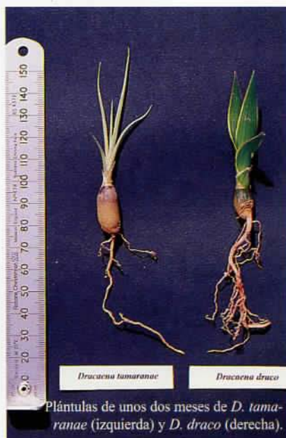
Plántulas de unos dos meses de D. tamaranae (izquierda) y D. draco (derecha).

sin descartar por supuesto otros aspectos de carácter intrínseco (agotamiento genético, problemas de polinización, etc.). En cuanto a los dragos obtenidos de las semillas recolectadas en 1994, los cuales corresponden a dos pies diferentes, se han plantado un buen número en diversas instituciones públicas, procurándose siempre que ha sido posible, mezclar las plantas. Asimismo se ha llevado a cabo una pequeña reintroducción en su hábitat natural, estando previsto efectuar alguna otra. La ubicación final de todas las plantas cultivadas y reintroducidas ha sido rigurosamente controlada por nuestra parte, con el fin de garantizar su seguimiento y valorar los resultados.