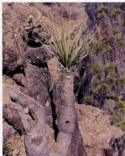
Ejemplar juvenil con el tronco acodado (probablemente a consecuencia de algún desprendimiento que lo desenraizó parcialmente).

pronto varias localidades que albergaban poblaciones naturales de dragos. No ocurrió lo mismo en Gran Canaria, donde los pocos personajes que la visitaron y la recorrieron con algún detenimiento—entre ellos Webb y Berthelot, Olivia Stone y Verneau—, no citan en ningún momento la presencia de ejemplares silvestres. Sólo el doctor VERNEAU (1996) menciona el gran árbol del ayuntamiento de Gáldar, plantado en 1718. Viera y Clavijo por su parte, se limita a indicar su presencia y a comentar la fama que dejó un gran drago, en cuyo tronco, ya socavado, se acogía una yunta de bueyes (VIERA Y CLAVIJO [1982]: 161), aunque no nombra la localidad. Sin duda, ya por entonces estas plantas debían ser bastante raras en la isla y estar muy localizadas.