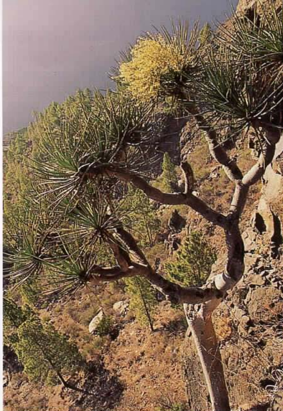
Vista oblicua superior del mismo drago, mostrando el aspecto de la copa y el detalle de la inflorescencia.

Otro aspecto que resulta cuanto menos paradójico es el hecho de que una de las especies vegetales más profusamente cultivadas en nuestro archipiélago y arraigada en la conciencia