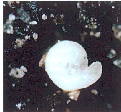
Abb. 4 Stadium II von S. caboverdus

Die embryonale Entwicklung dauert in dieser Erdkapsel unter Laborbedingungen bei 23°C ca. 22 Tage. Am Ende der Embryonalentwicklung sind durch die Eihaut schon