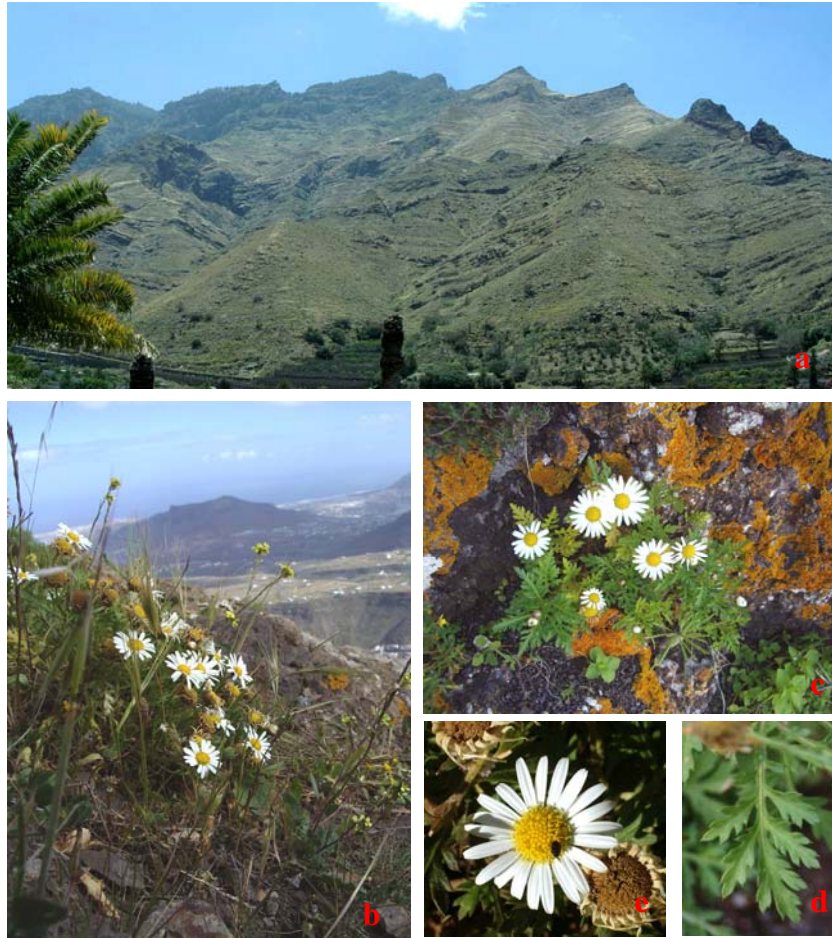
Figura 1. Argyranthemum lidii . a: Panorámica que abarca varios enclaves como Roque Bermejo, Roque de la Sombra, Morro Abejero y Pico Gavilán (La Higuera), montaña Berbique y el Andén del Cuervo, al fondo Tamadaba. b: desde la población de La Higuera y al fondo la montaña de Amagro. c: Porte de una planta. e y d: Detalle del capítulo en flor y de una hoja.

También en esta misma vertiente (SE) se pueden localizar otros 25 individuos (28RDS3311-D) dispersos por una franja de ladera de suave pendiente (situada entre dos picos de 503 y 497 m s.m.), hasta terminar en un llanete (400 m s.m.) con unos 130 ejemplares que se distribuyen tanto dispersos como en rodales (28RDS3311-B-D y 28RDS3411-A-C). Por último, bajando desde el borde del llanete hasta alcanzar media falda de la montaña se localizan de forma muy dispersa unos 45 individuos (28RDS3411-A-C, 28RDS3311-D).