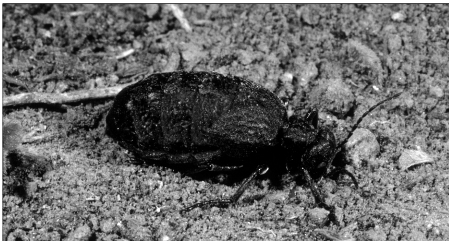
Meloe flavicomus Wollaston, 1854.