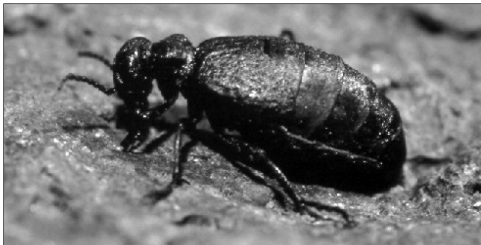
Meloe mediterraneus Müller, 1925. (Foto: R. García).

(San Andrés y Sauces), 560 m, 20-12-1985, 3 exx. deambulando por pista junto con M. fernandezi . – Bco. del Carmen (S/C de La Palma), 100 m, 14-3-1988, 3 exx. – Martín Luis (Puntallana), 90 m, 4-1-1989, 1 ex. escondido entre las ramas caídas de una tabaiba seca. – El Pocito (Mazo) 100 m, 26-3-1990, 1 ex. bajo piedra en huerta abandonada. – Mtna. de Triana (Los Llanos de Aridane) 360 m, 23-11-1990, 2 exx. bajo tablas. – La Puntilla (los Llanos de Aridane) 300 m, 25-4-1996, 2 exx. activo de noche. – Bco. de Tamanca (Los Llanos de Aridane) 300 m, 8-2-1998, 1 ex. bajo piedra. – Bco. Jurado (Tijarafe), 460 m, 23-12-1998, 1 ex. bajo piedra. – Salto de Tegalate (Mazo), 210 m, 26-5-2000, 2 exx. bajo piedra en cantero. – Juan Adalid (Garafía), 30 m, 28-12-2001, 1 ex.; 25-4-2002, 2 exx. alimentándose de noche de pequeños cardos. – Bellido (Tijarafe), 450 m, 4-1-2004, 1 ex. alimentándose de noche de pequeños cardos.