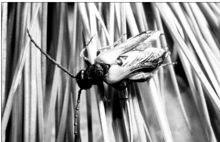
Sitaris solieri solieri Pecchioli, 1839. (Foto: R. García).

Sitaris solieri solieri : Oromí et al. en: Izquierdo et al. , 2004: p. 233