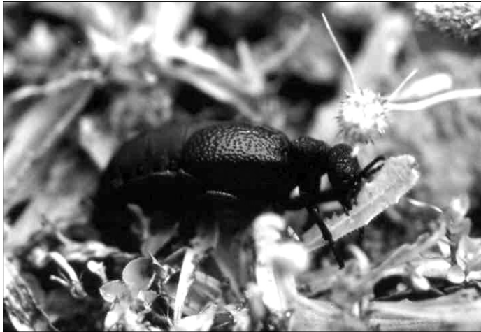
Meloe tuccius tuccius Rossi, 1792.

Meloe tuccius tuccius : Oromí et al. en: Izquierdo et al. , 2004: p. 233