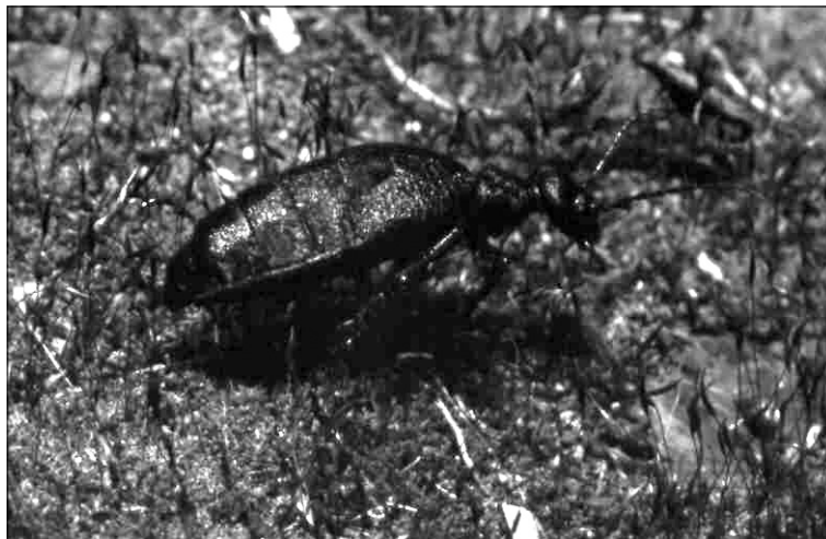
Meloe fernandezi Pardo, 1951. (Foto: R. García).

Meloe fernandezi : Oromí et al. en: Izquierdo et al. , 2004: p. 233