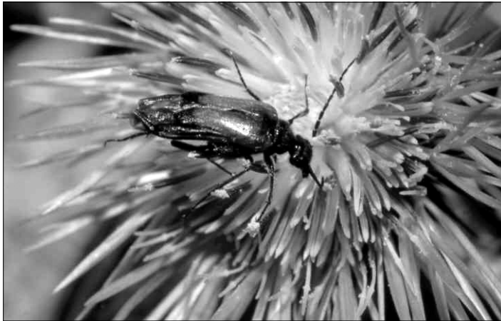
Stenoria canariensis (Pic, 1902).

Stenoria canariensis : Oromí et al. en: Izquierdo et al. , 2004: p. 233