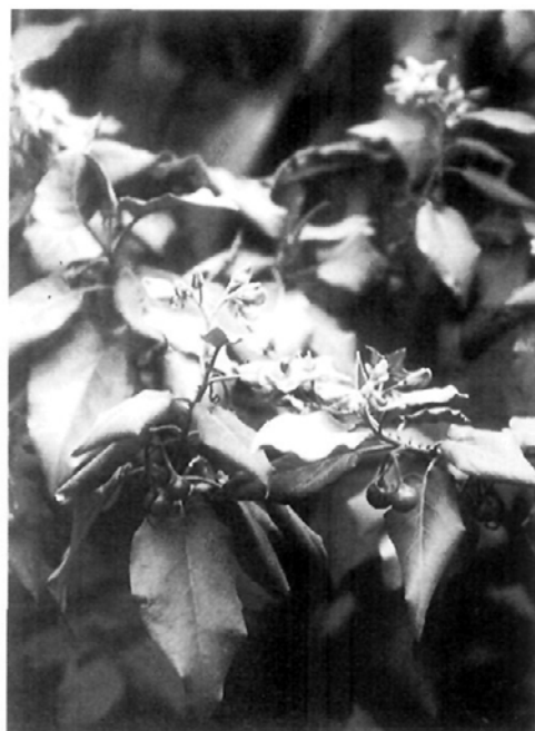
Fig. 1.— Solanum vesperilio subsp. doramae .

18298 LPA. Ex horto Vivero Forestal de Tafira, 19-VI-1997, M. González Martín, 18296 LPA (duplic. in 593446 MA).