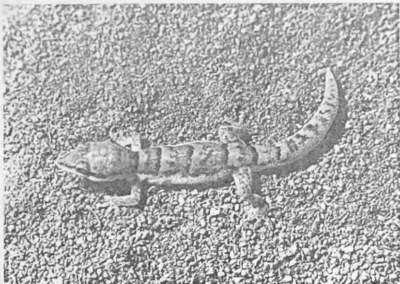
Abb. 1: Hemidactylus bouvieri razoensis nov. ssp. von Razo, Kapverden.