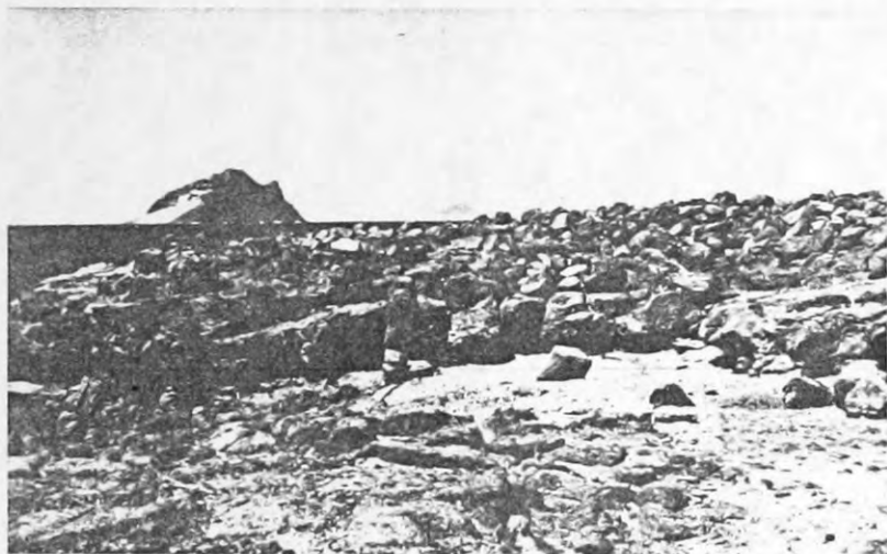
Abb. 3: Der Biotop von Hemidactylus bouvieri razoensis n. ssp.; Küstenbereich im Westen der Insel mit Blick auf Branco, St. Luzia und S. Vicente.

Die Werte der Regressionsgeraden betragen für razoensis : n = 10 , Slope = 3,31, Corr. = 0,90, Intcp. = 2,08 und für boavistensis (Aufsammlung von Sal und Boa Vista): n = 30 , Slope = 4,62, Corr. = 0,90, Intcp. = -9,65. Die mit „Lit.“ bezeichneten Werte sind der Literatur entnommen.