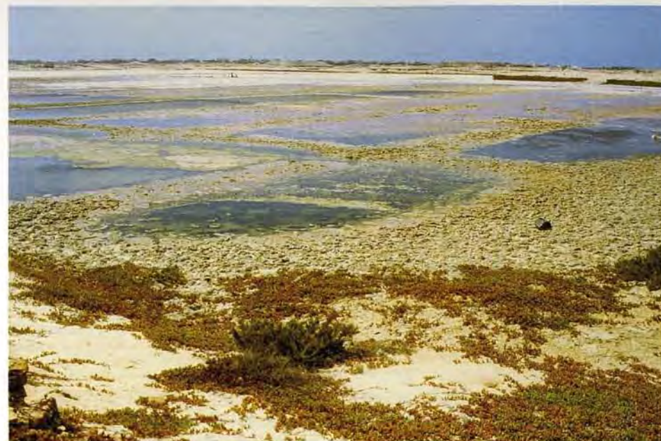
Figura 2. Vista parcial de las salinas de Santa Maria (isla de Sal), enclave de especial interés para las aves limícolas. (Foto: R. Barone).