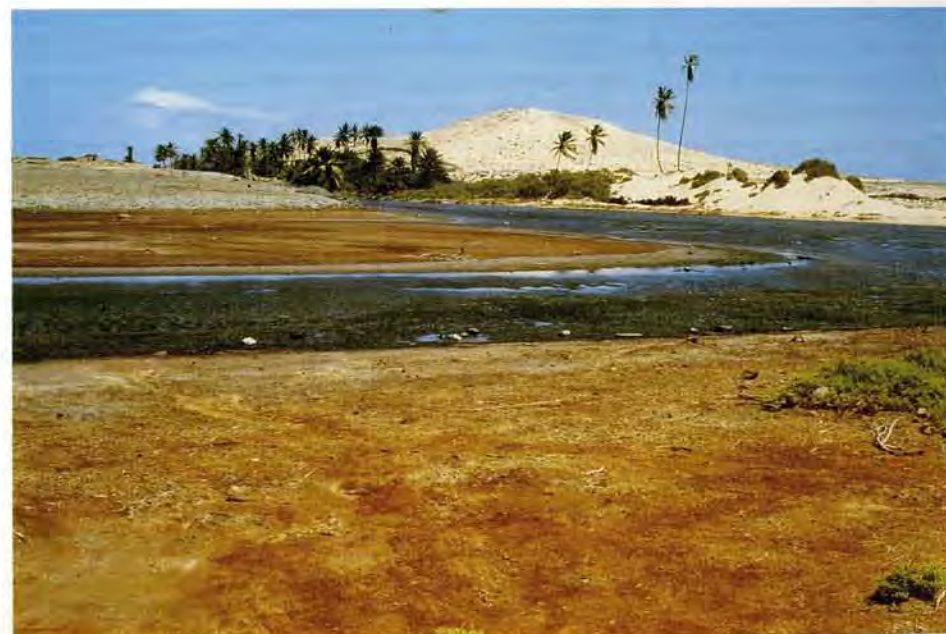
Figura 3. Desembocadura de la Ribeira do Ervatão (isla de Boavista), con su pequeña laguna.