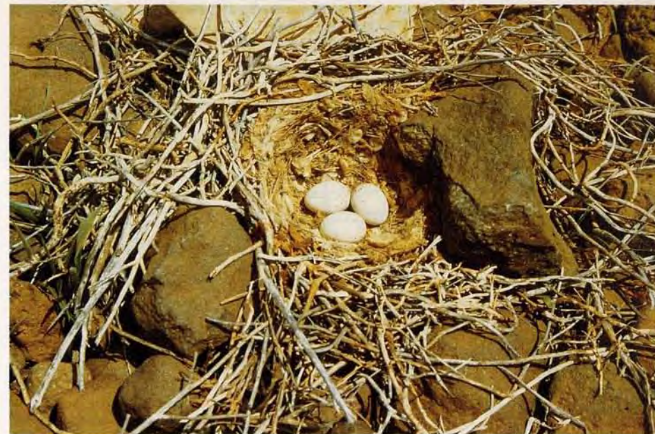
Figura 5. Nido de Alondra Ibis ( Alaemon alaudipes ) hallado junto a la pista a Curral Velho, Boavista.