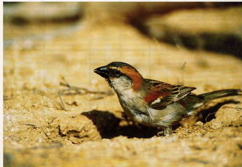
Figura 6. El Gorrión Grande ( Passer iagoensis ) es una de las especies endémicas de Cabo Verde. En la imagen, un macho adulto.