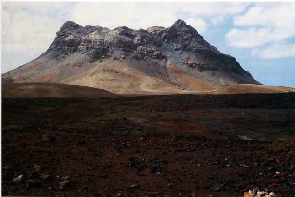
Figura 4. Rocha Estância (isla de Boavista). En esta montaña se reproducen sendas parejas de Neophron percnopterus y Pandion haliaetus , y existen referencias de la presencia de Tyto (alba) detorta .