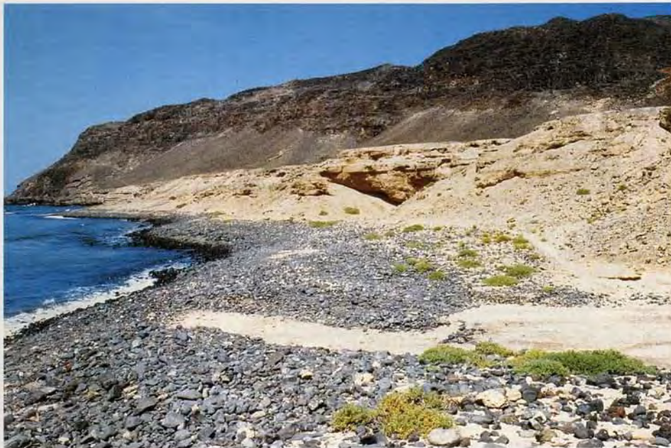
Figura 3. Acantilados de Praia da Fátima - Ponta do Sol (isla de Boavista). Este lugar es de vital importancia para las aves marinas y rapaces que nidifican en la isla.