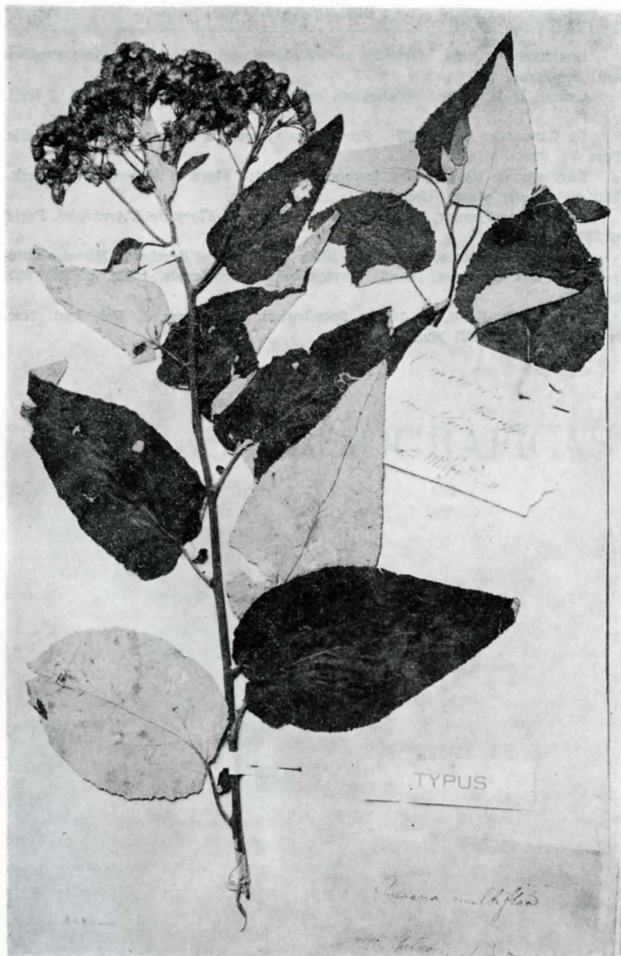
Senecio multiflorus (FI)