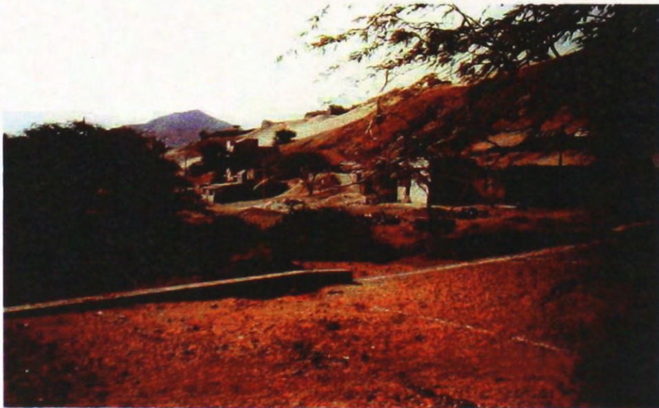
Fot. 6 – Mindelo – mini-barragem de correcção torrencial entulhada e casas construídas no talvegue da ribeira.