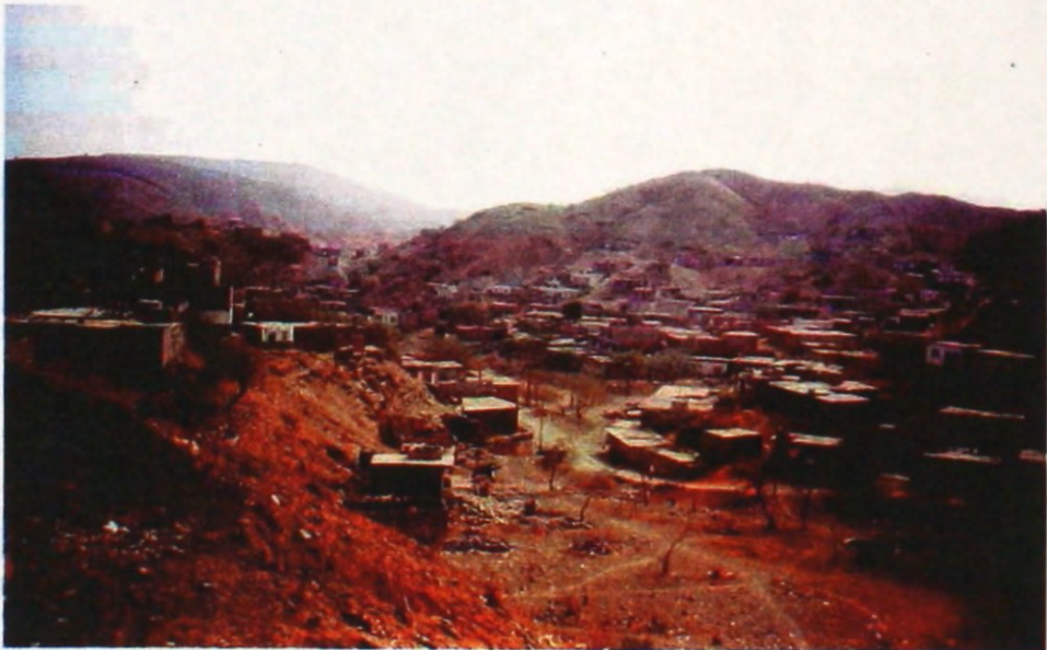
Fot. 4 - Praia - limite urbano em talvegue de ribeira