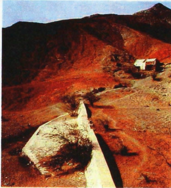
Fot. 5 – Mindelo – mini-barragem de correcção torrencial semi-entulhada.