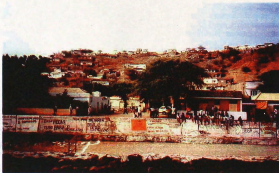
Fot. 2 – Praia – aproveitamento de leito de ribeira para campo de futebol, com muro-dique profundo