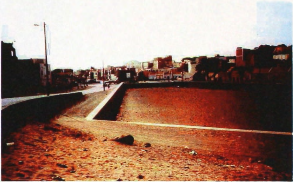
Fot. 7 – Mindelo – leito de ribeira cortado para jusante por muro e casas.