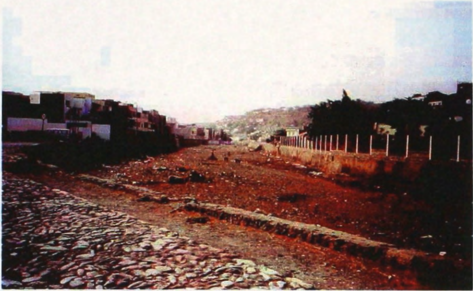
Fot. 3 - Praia - leito de ribeira com blocos, calhaus e lixo com muro-dique semi-destruído