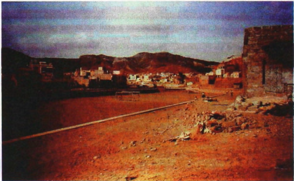
Fot. 8 – Mindelo – campo de jogos em leito de ribeira delimitado por muro-dique de pequenas dimensões.