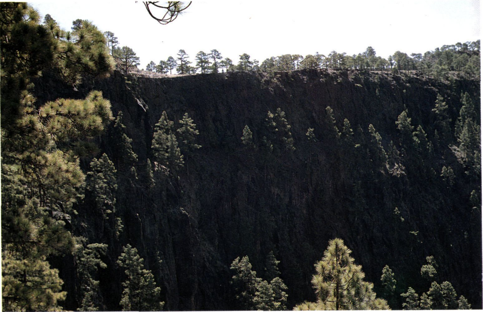
Figura 2.- Andenes de Tasarte, ambiente donde crece Helianthemum inaguae sp. nova.