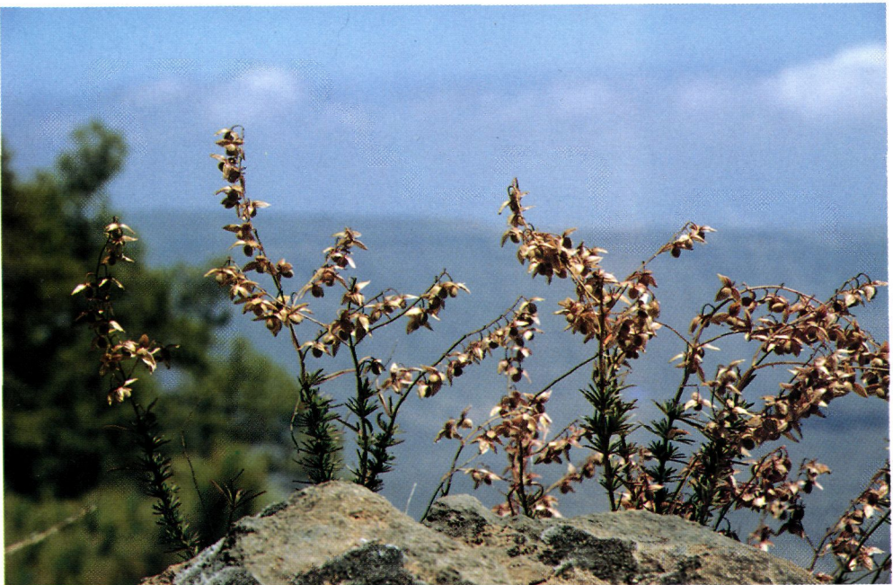
Figura 3.- Detalle de infrutescencias de un individuo de Helianthemum inaguae sp. nova.