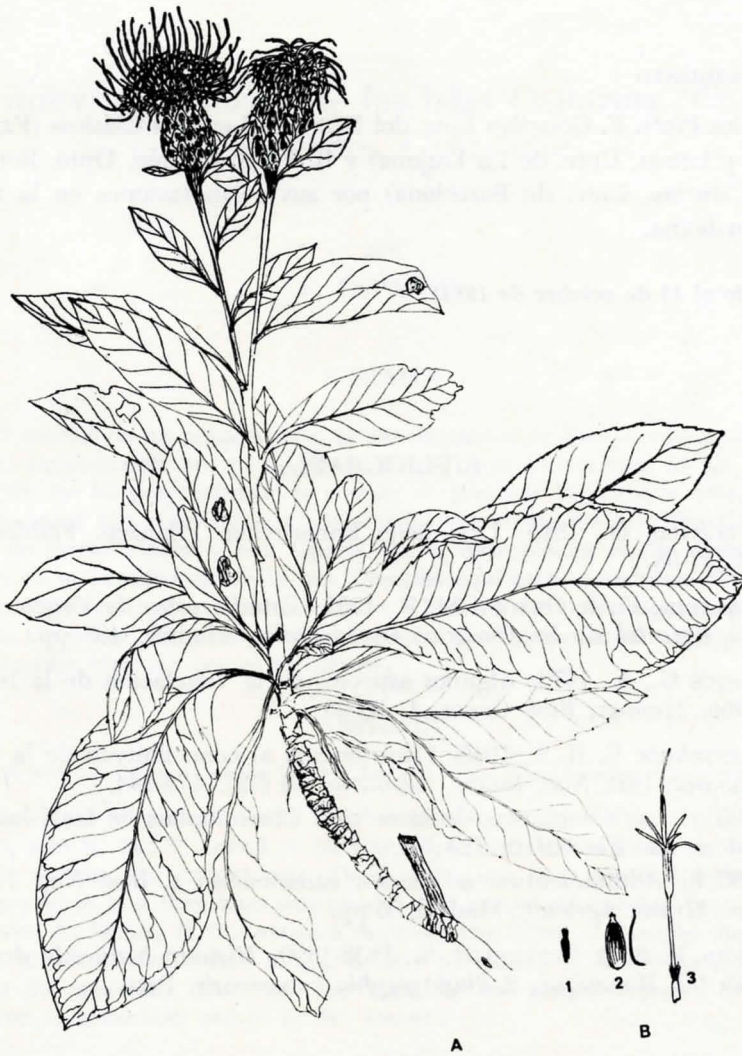
Explicación de la lámina: A. Rama con flores. B. Detalles de flor y fruto: 1 Aquenio, 2 Bráctea capitular media, 3 Flósculo. (X 1/2)