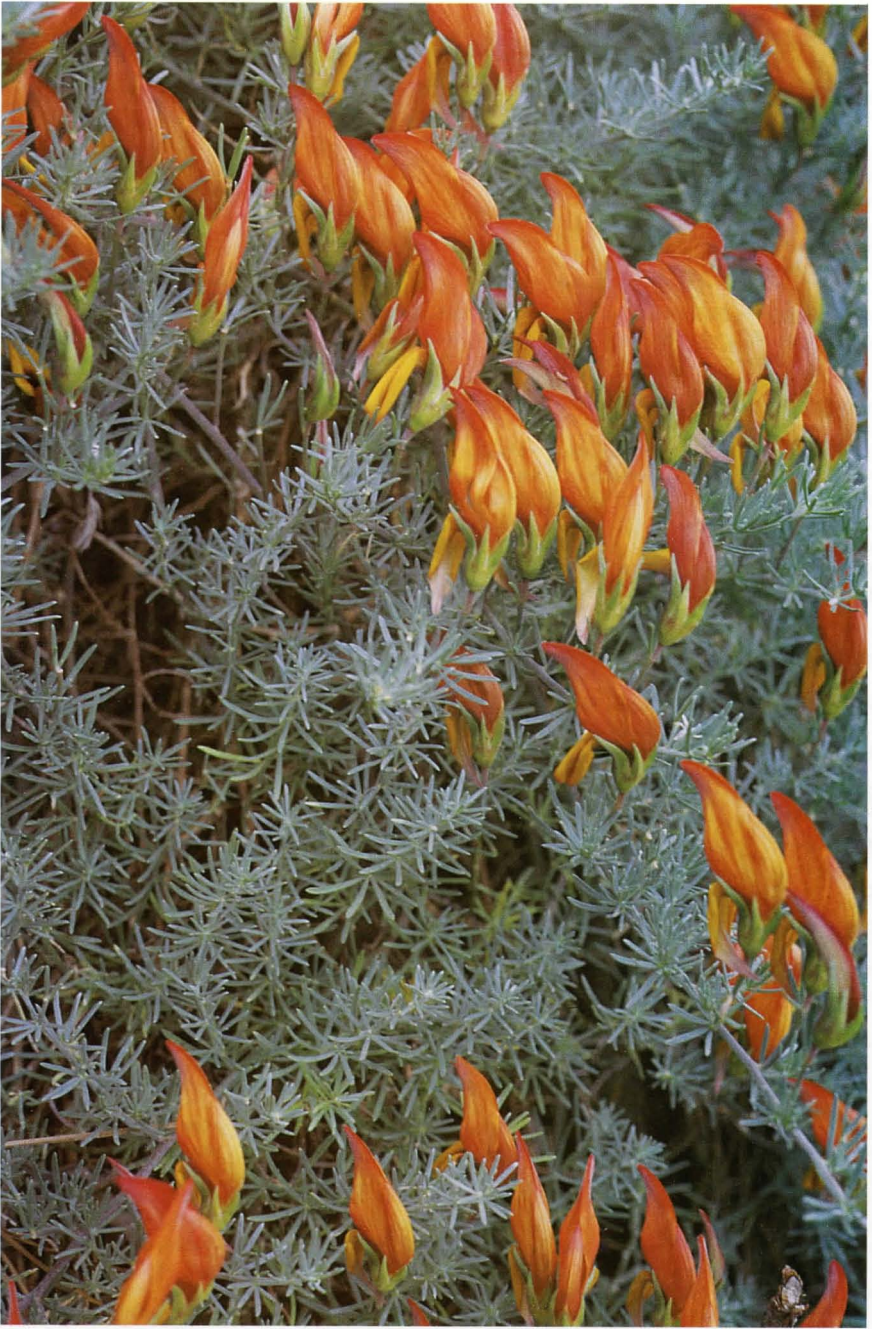
Fig. 2.- Lotus pyranthus sp. nov.