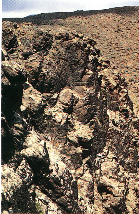
Figura 3.- Hábitat de Helichrysum alucense sp. nov.