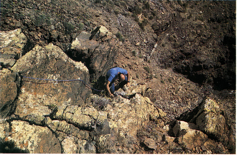
Figura 2.- Aspecto parcial de la población de Helichrysum alucense sp. nov.