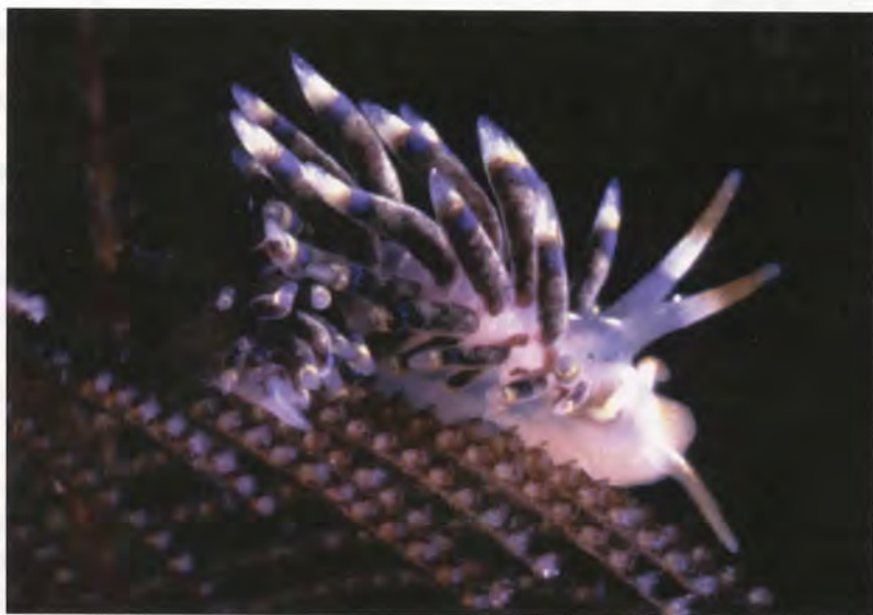
Lámina 1.- Cuthona herrerae n. sp., fotografía de un ejemplar vivo.