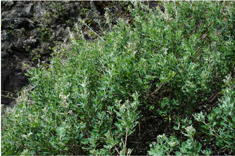
Figura 3.- Teline stenopetala (Webb & Berthel.) Webb & Berthel. subsp. santoantaoi , subsp. nov. Arriba: ambiente donde crece la planta, pared exterior de Cova de Paul, en los riscos altos de esta Ribeira. Abajo: detalle de una planta.