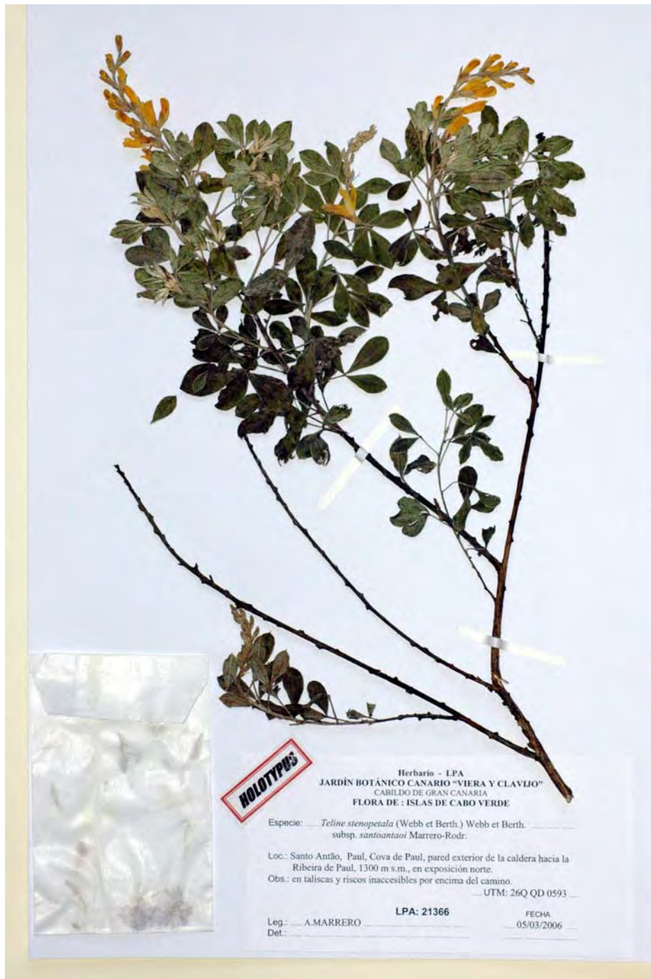
Figura 1.- Teline stenopetala (Webb & Berthel.) Webb & Berthel. subsp. santoantoi Marrero-Rodr., subsp. nov., LPA: 21366. Holotypus .